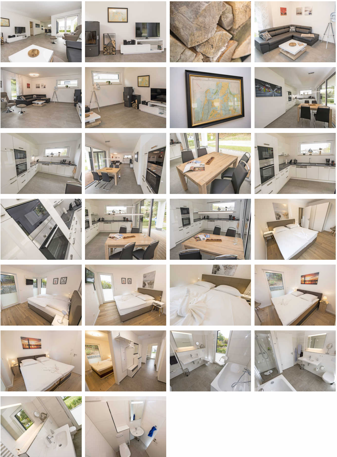
Dieses komfortable 3-Raum-Appartement im EG überzeugt u.a. mit einem Kamin und der großen möblierten Südwest-Terrasse inkl. Strandkorb. Auch mit Hund buchbar! Wohnung „Ankerplatz 15“