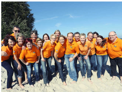
Objekt ID: 66781